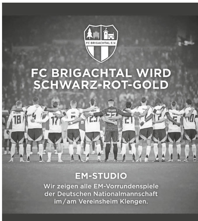
EM-Studio im Vereinsheim