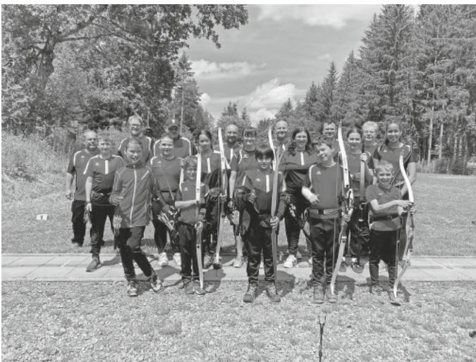
Unsere erfolgreichen Teilnehmer!

Wir gratulieren allen Teilnehmern und Kreismeistern!